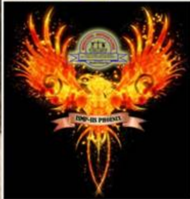
ISMP-IIS Phoenix Aerie

This is a very prescient house which is founded on the virtues of faith and hope. Phoenixes have the ability to heal all wounds, whether psychological, emotional and physical. Their knowledge transcends the depths of human ken for the Phoenix knows the secrets of the stars. Further, Phoenixes rise up from the ashes and are very spiritual. They exist to prevail until the very end.