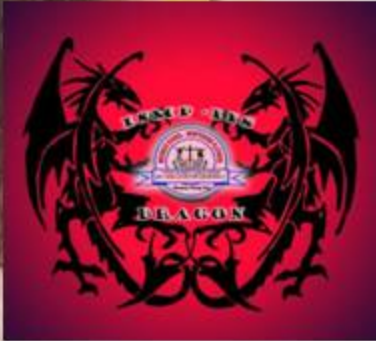
ISMP-IIS Dragon Lair

This is a very ancient house which is founded on the virtues of courage, wisdom and knowledge. Dragons are red-water-dwellers and are famous for being secretive, stealthy, sly, patient, strong and aggressive. They are ever on the go and they never balk at any challenge given to them. They exist to be victorious at all times.