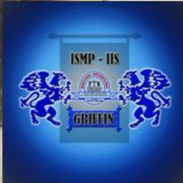
ISMP-IIS Griffin Cave

This is a very vibrant house that is founded on the virtues of unity and cooperation. Griffins represent unity in diversity. They have the ability to merge with the environment thereby rendering them invisible. They are so resourceful that they can adapt to any biosphere and find practical solutions to any problem that that environment brings. They exist to out-survive others.