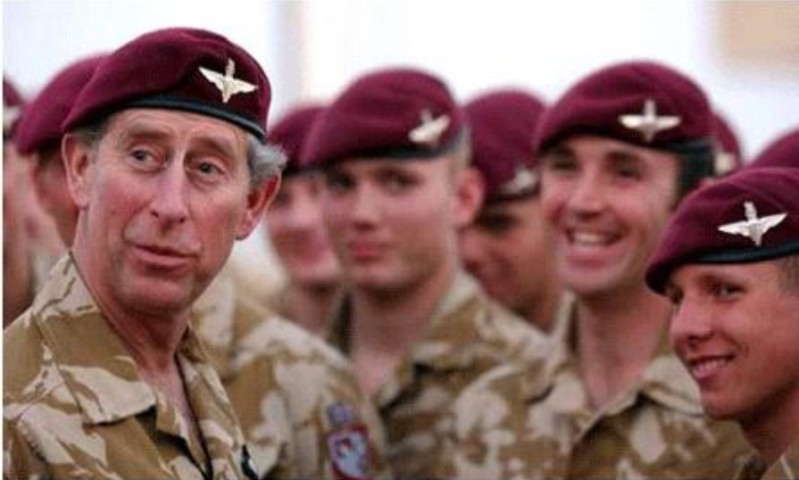
<숨은 실력자, Prince of Wales>

Illuminati 지도부는 자신들이 황실의 후예이며, 대대로 이어지는 신비주의 유산의 상속자들과 있다고 얘기합니다. 그들이 말하는 “황실”에는 두 가지의 유형이 있습니다. 하나는 모든 사람들의 눈에 보이는 ‘open royalty’이며, 다른 하나는 강력한 신비주의 파워를 보유한, 보이지 않는 ‘hidden royalty’입니다. Open과 hidden royalty가 겹치는 사례도 가끔 있습니다. Wales의 황태자(찰스 황태자)가 바로 그러한 경우입니다. 저는 조직 내에서 일상적인 업무를 수행하는 신분이었기 때문에, 어느 국가/계열이 가장 막강한 힘을 가지고 있는지에 대해서는 깊게 생각해 본 적이 없습니다만, 제가 알고 있기로는 이렇습니다.