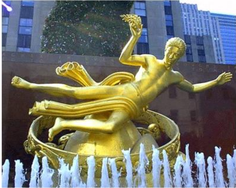
<Rockefeller Center 건물 앞에 세워진 Prometheus(인류에게 불 - 즉, Illuminati가 숭배하는 '빛' - 을 전해 주었다가 천벌을 받은 신)의 동상>

Illuminati의 국가 위원회는 영향력 있는 은행가들(현재 우리가 사용하고 있는 돈을 지배하고 있는 사람들)로 구성되어 있습니다: Rockefeller 가문, Mellon 가문, Carnegie 가문, Rothschild 가문 등이 이에 포함됩니다. 실명을 거론하는 것은 바람직하지 않지만, 공개해 버리도록 하겠습니다.