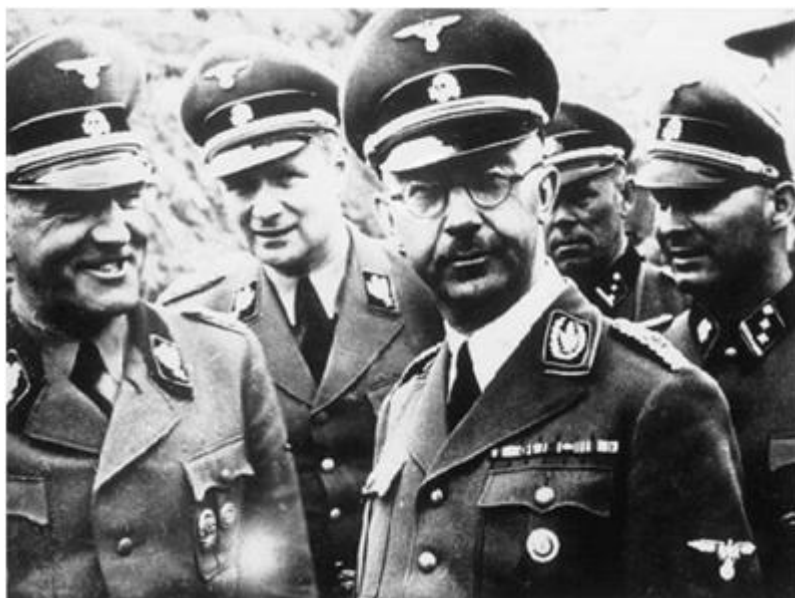
<Nazi의 실세, Heinrich Himmler >