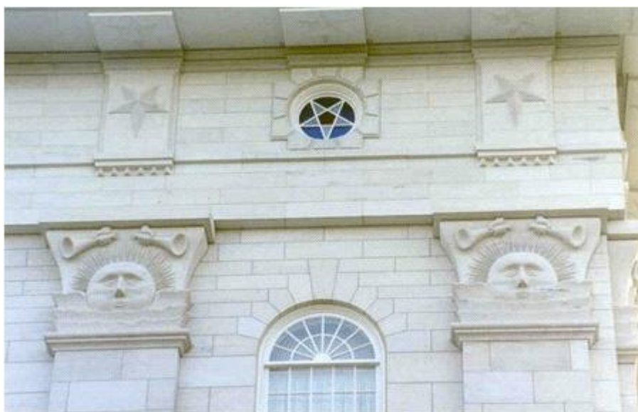
<Mormon 교회 건물 외부 (역 오각형 문양과 태양에 주목) >