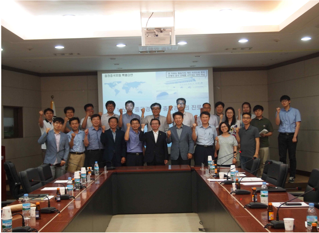
〈그림 2〉 포럼 단체사진

◎ 다음 포럼은 8월 26일(수), 대외경제정책연구원 성별·권역별 연구단 김부용 박사께서 “베이징, 텐진, 허베이(京津冀)지구 일체화 추진정책과 시사점(잠정)”이란 주제로 발표해 주실 예정입니다.